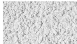
zrניות 2,0 mm