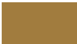
zlatá (RAL 1036)

Údaj v závorce definuje nejbližší RAL odstín. Barevnost odstínů je pouze orientační a odpovídá použité technologii tisku.