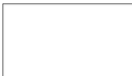
bílá (RAL 9002)

Vzorník aktuálních odstínů Primalex Jednovrstvá barva 2v1