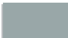
0101 pastelový sivý